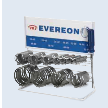
90300- series 站立式掛板展示架