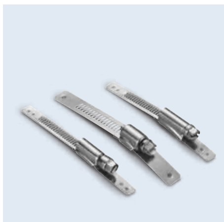
14040- / 24040- series 直式管夾