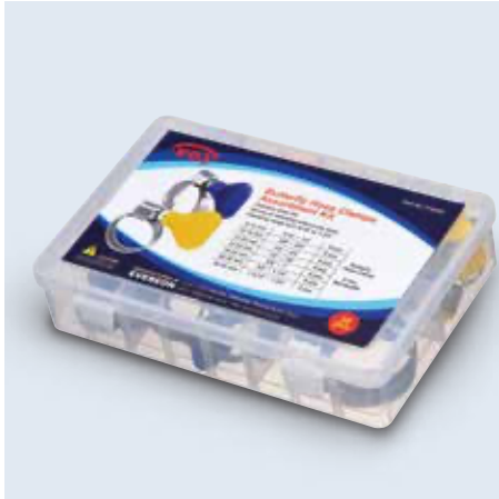
90700- series 塑膠盒套組