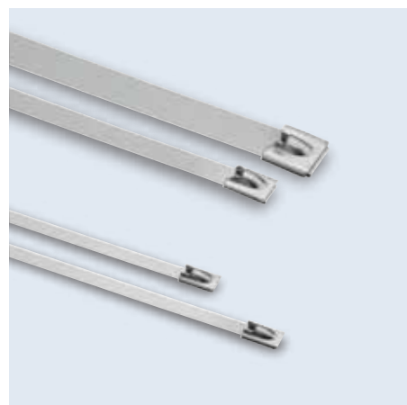
37000- series 珠式管束