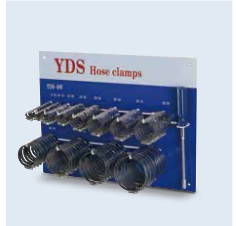
90100- series 鐵掛板展示架