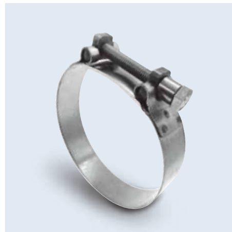
50040- series 高壓管夾