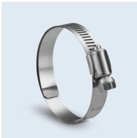
20700- / 20900- series 內襯管夾