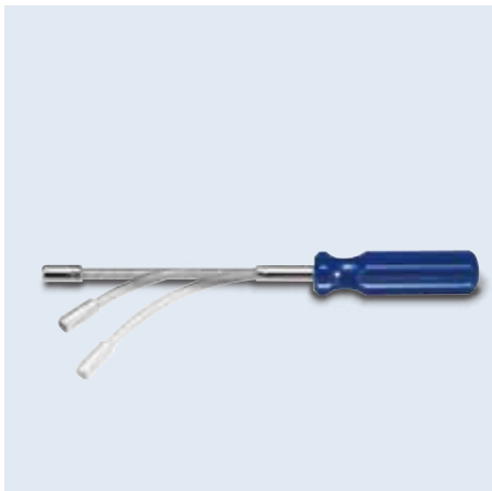
80011- series 軟桿起子