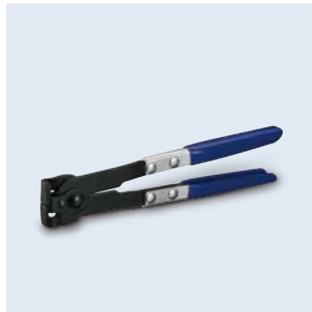
80013- series 耳式鉗子工具