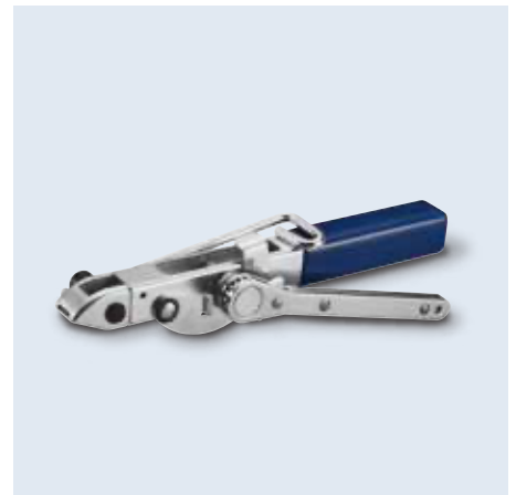
80012- series 手拉式工具