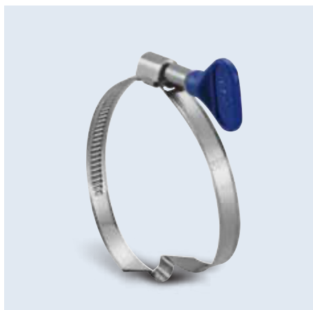
19027- series 橋式管夾