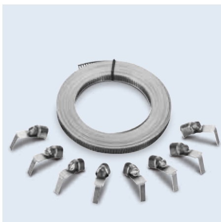
62000- series 捲式管夾