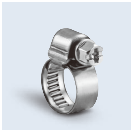
10520- series 微小管夾